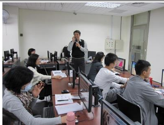
兩場參與人數合計 90 人次