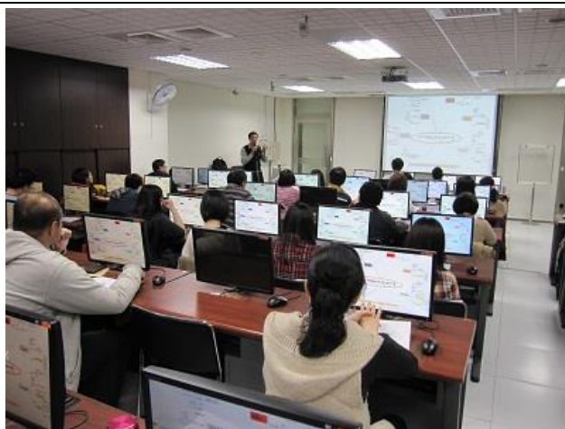
參與人員包含教職員生