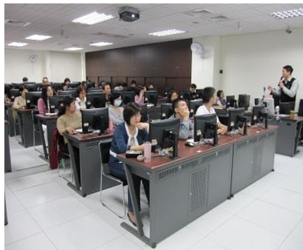
全程參與者致贈自由軟體行動教學隨身碟 4G