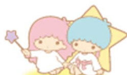
Little Twin Stars