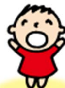
Minna No Tabo