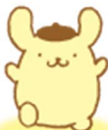
Pom Pom Purin