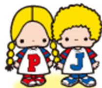
Patty & Jimmy